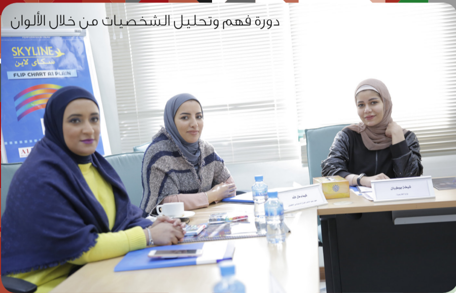
دورة فهم وتحليل الشخصيات من خلال الألوان