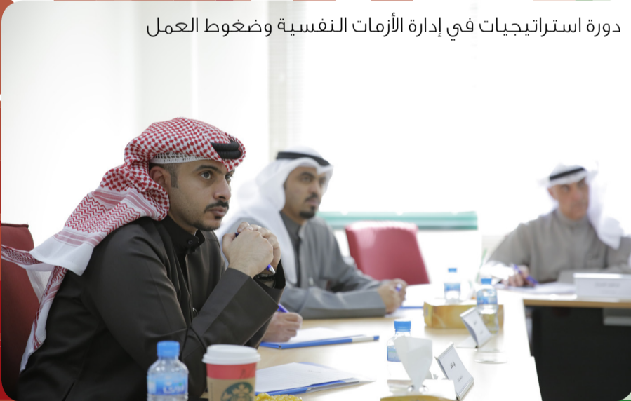
دورة استراتيجيات في إدارة الأزمات النفسية وضغوط العمل