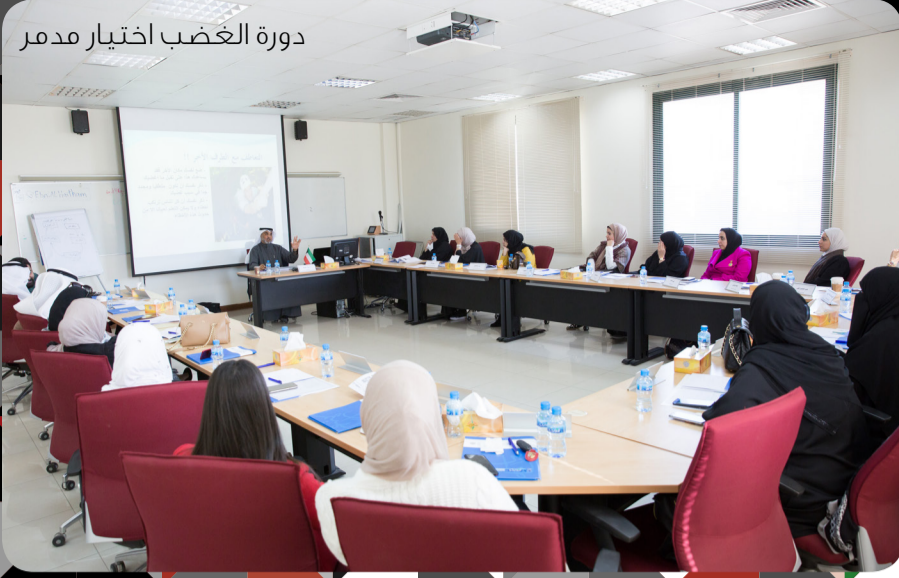
دورة الغضب اختيار مدمر