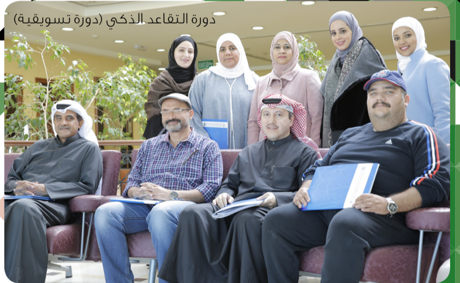
دورة التقاعد الذكي (دورة تسويقية)