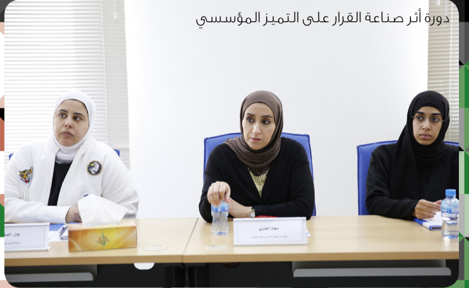
دورة أثر صناعة القرار على التميز المؤسسي